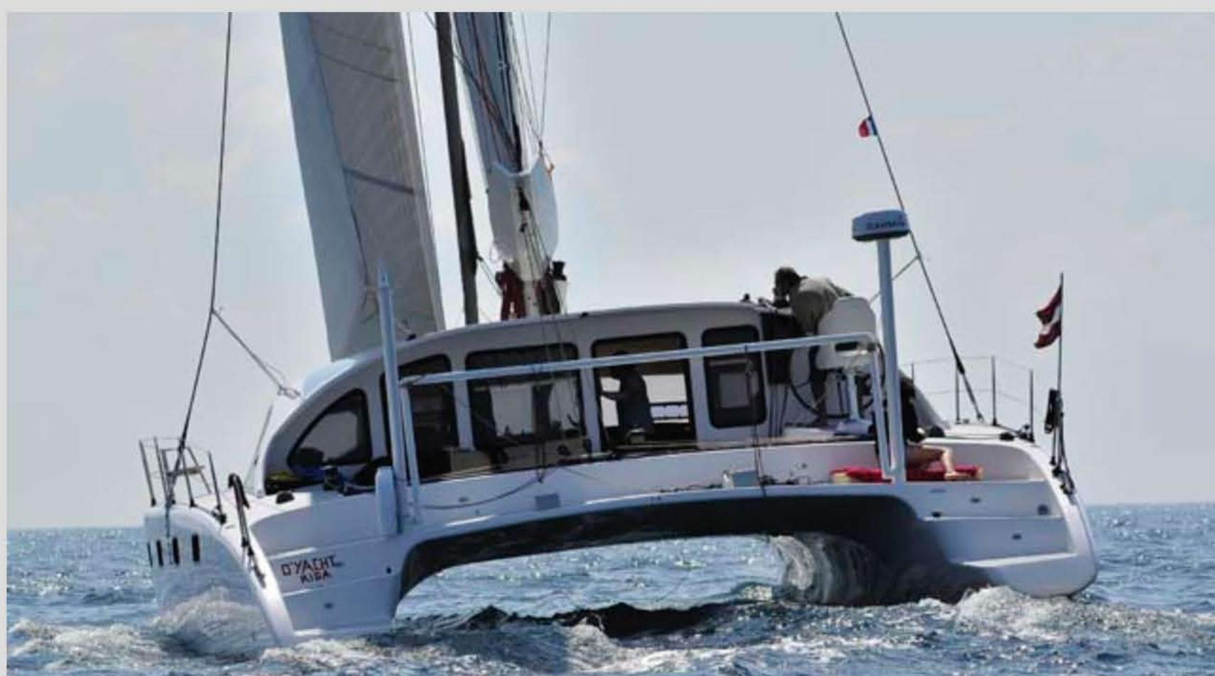
La neonata Class 4 è stata presentata a Cannes e ora è disponibile per prove in mare a Fréjus

Il Class 4 è un catamarano sportivo che trova conferma nel disegno degli scafi, della coperta e soprattutto del generoso piano velico disegnato da Erik Lerouge. Il catamarano, dal dislocamento di soli 7.000 kg grazie al largo uso del carbonio lavorato per infusione sottovuoto, naviga in configurazione regata, con vele in carbonio e albero ruotante sempre in carbonio di 19,40 m.